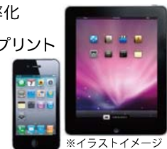
※イラストイメージ